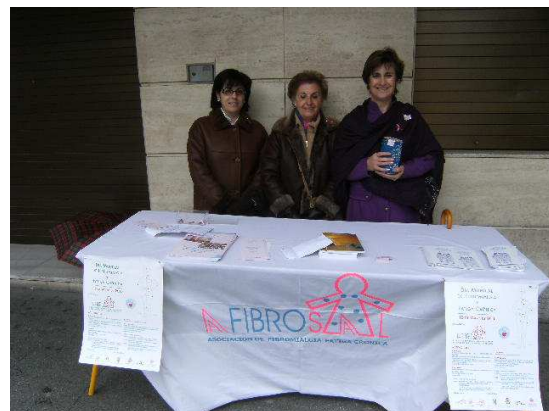
Mesa Plaza de España