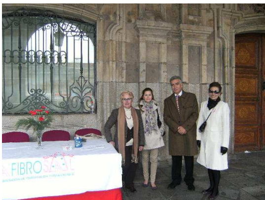
Mesa Plaza Mayor

El 14 de mayo se instalaron las mesas informativas en la Plaza de la Estación, Plaza de España, Puerta Zamora, Plaza Mayor, Calle Toro, Hospitales y Universidades.