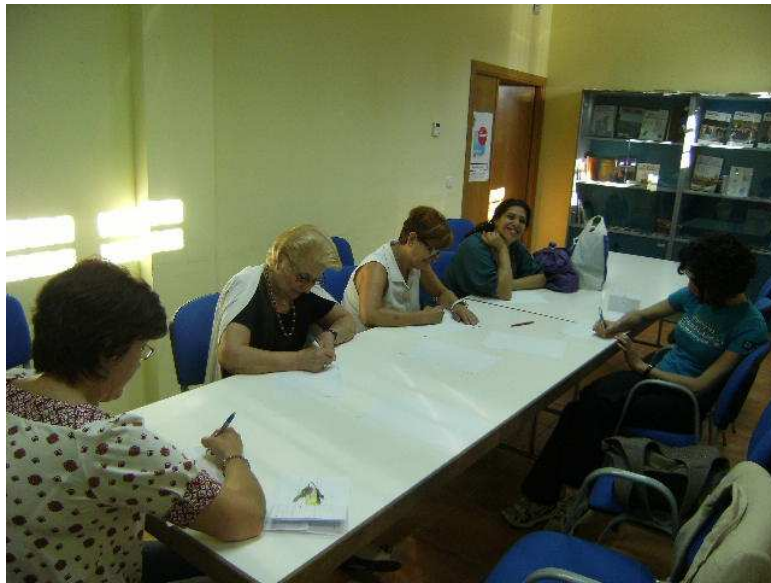
Momento de la actividad

asistentes manifestaron su intención de aplicar las estrategias aprendidas en su vida cotidiana. En definitiva, y tras todo lo expuesto se puede asegurar que el taller de memoria ha tenido unos resultados muy satisfactorios que se manifiestan en circunstancias como que sus participantes estén dispuestos a continuar si en el futuro se sigue desarrollando esta actividad. Por su parte, la profesional encargada de la realización del taller se ha mostrado muy satisfecha con la implicación de los participantes y con la interiorización de los contenidos abordados, considerando que los objetivos planteados se han visto cumplidos.