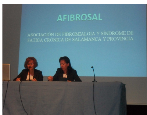
Peñaranda de Bracamonte