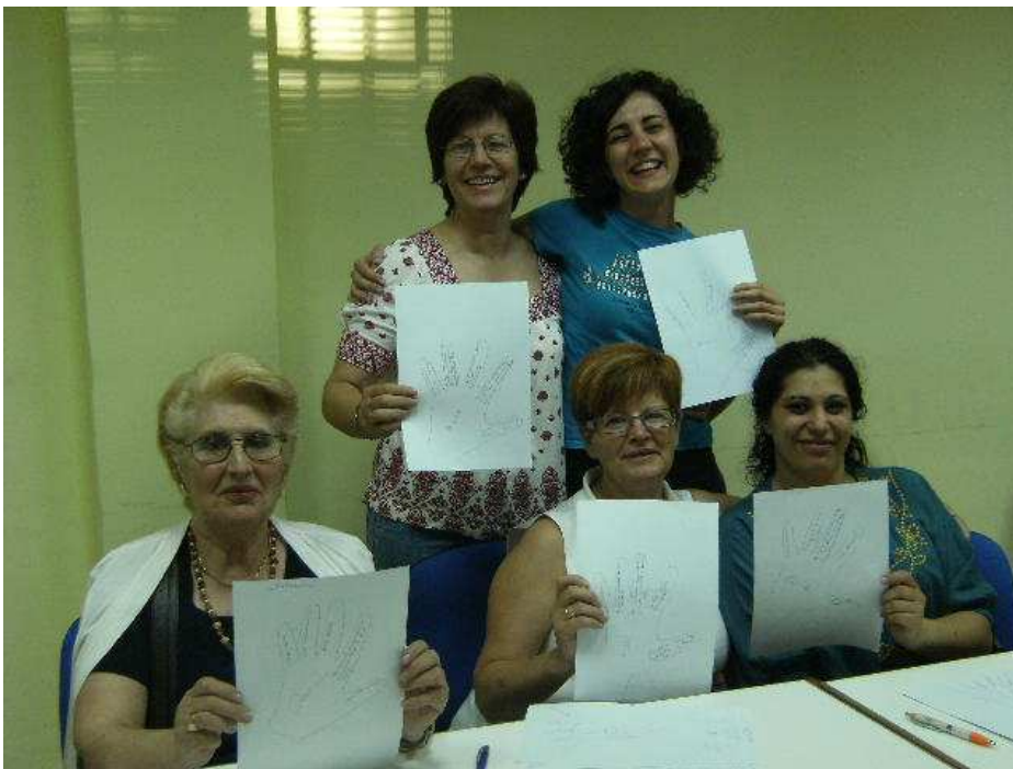
Algunas de las participantes

Por género las diferencias eran claras, el grupo estaba compuesto por una totalidad de mujeres.